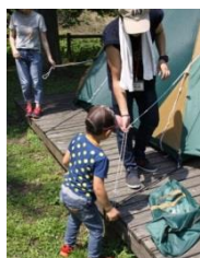
みんなで協力して テントを張るよ