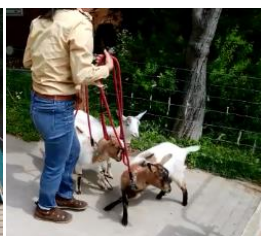
子ヤギたちは中型犬くらいの 大きさです。 人懐こい子ばかりなので、 ヤギとのふれあいが初めて の方でも安心！